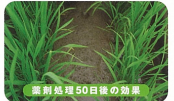
薬剤処理50日後の効果