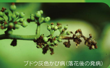
ブドウ灰色かび病(落花後の発病)