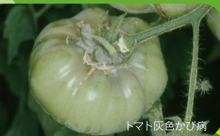
トマト灰色かび病