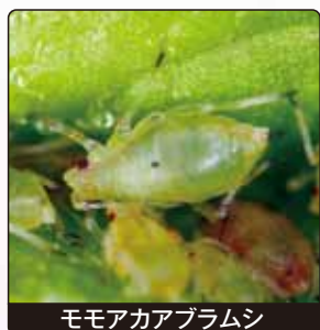
モモアカアブラムシ