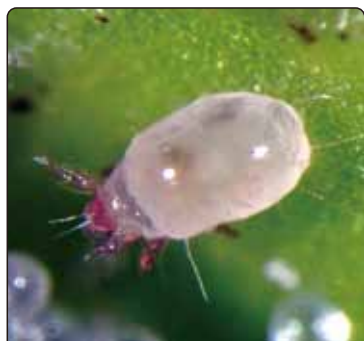
ホウレンソウケナガコナダニ