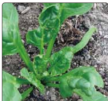
ホウレンソウケナガコナダニ被害